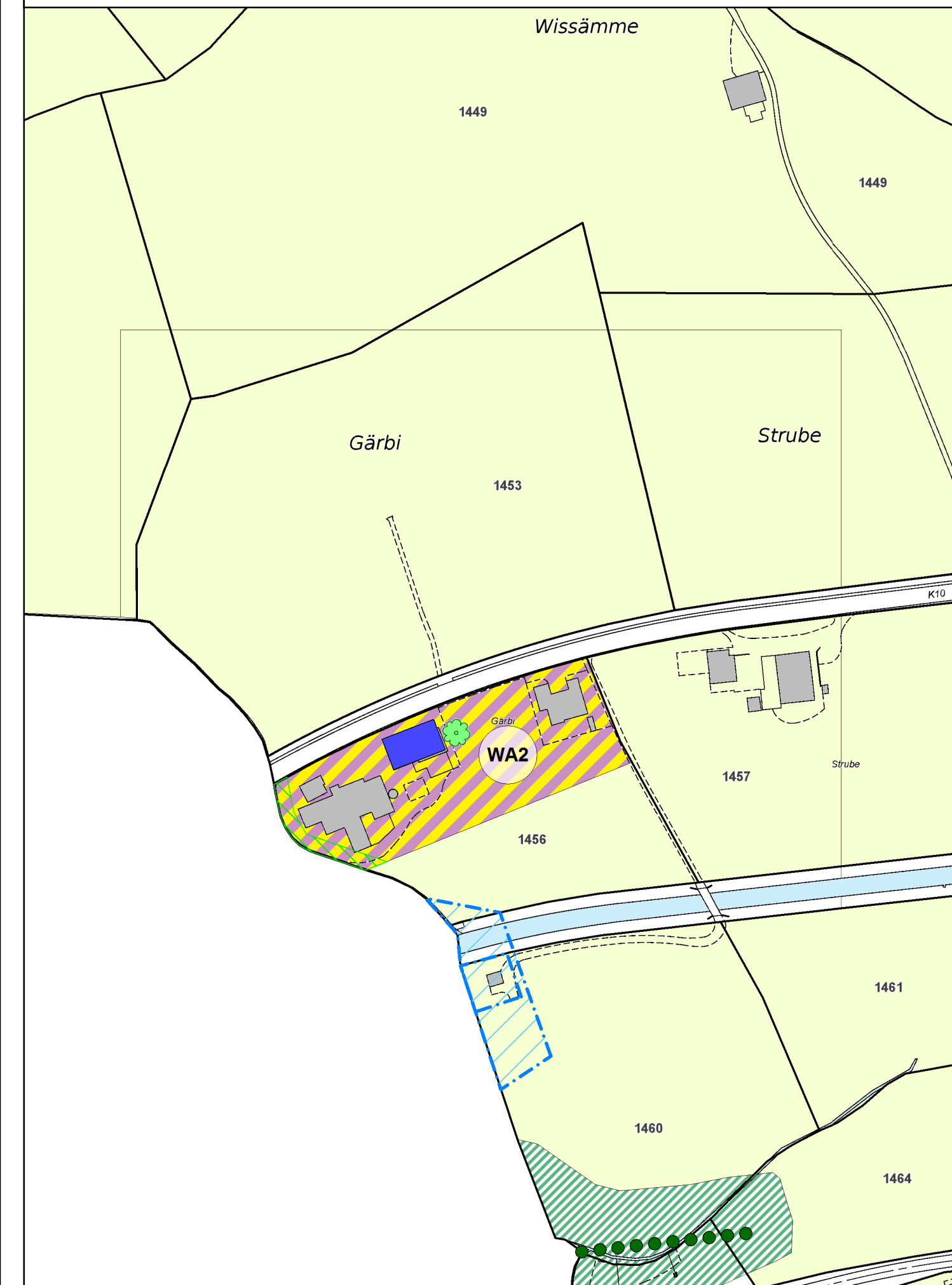
Ausschnitt ZP Gärbi 1:2'000