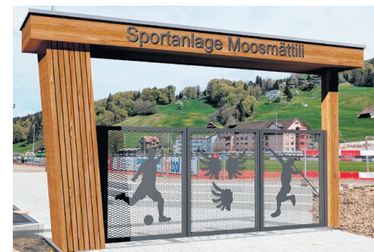
Künftiges Eingangsportale Sportanlage.